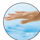
VISCOELÁSTICA CON GEL