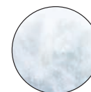
ACOLCHADO CON FIBRAS HIPOALERGÉNICAS